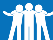
Compromiso de los Jóvenes